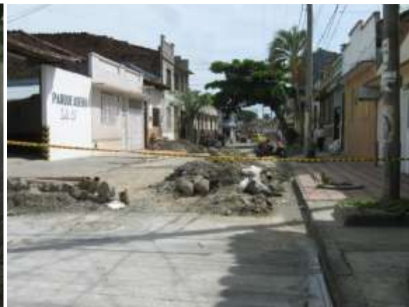
CALLE 17 ENTRE CARRERAS 5ª Y 6ª

CONTRATO No 4 – 084 DE 2014 CONTRATISTA TRITURADOS & CONCRETOS LTDA OBJETO MEJORAMIENTO DE LA MALLA VIAL MEDIANTE CARPETA ASFALTICA BACHEO MUNICIPIO DE CARTAGO VALLE DEL CAUCA