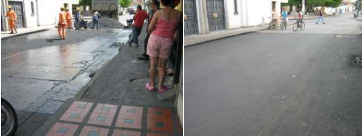
CALLE 4ª CARRERA 4ª