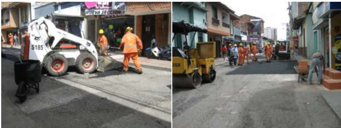
CARRERA 4ª CALLES 7ª Y 8ª