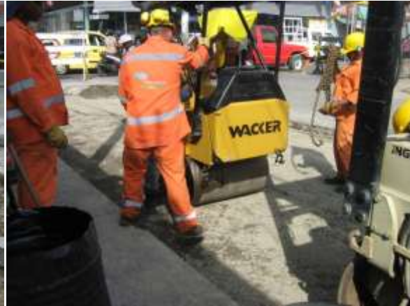
CARRERA 6ª CALLE 10