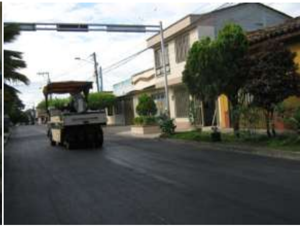
CALLE 20 ENTRE CARRERAS 4ª Y 5ª