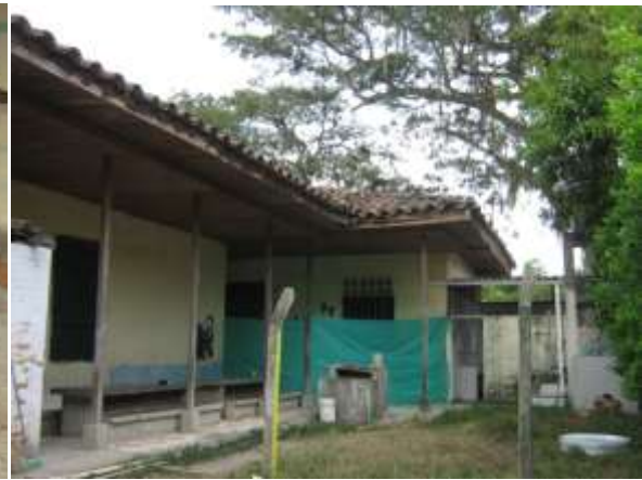
CDI VILLA MANUELA BARRIO SANTA ANA