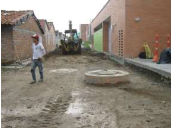
CDI SUEÑOS Y SONRISAS