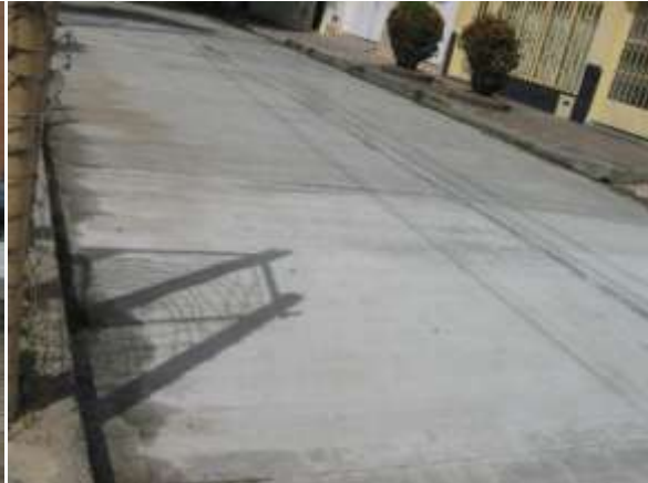
CALLE 18 ENTRE CARREAS 3ª Y 4ª