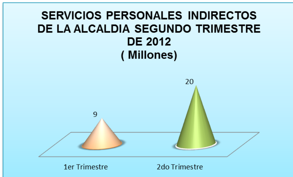
Grafico No. 3