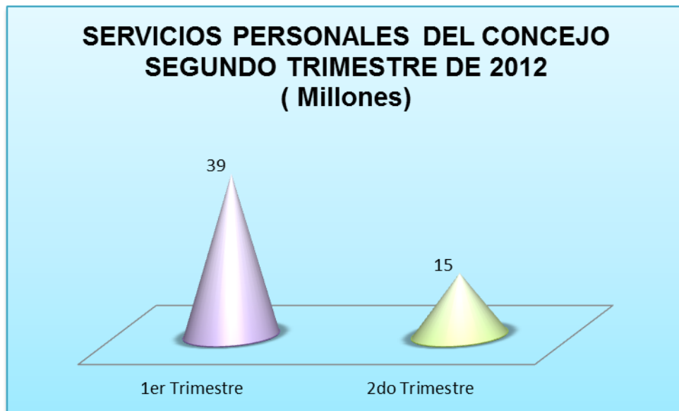
Grafico No. 1