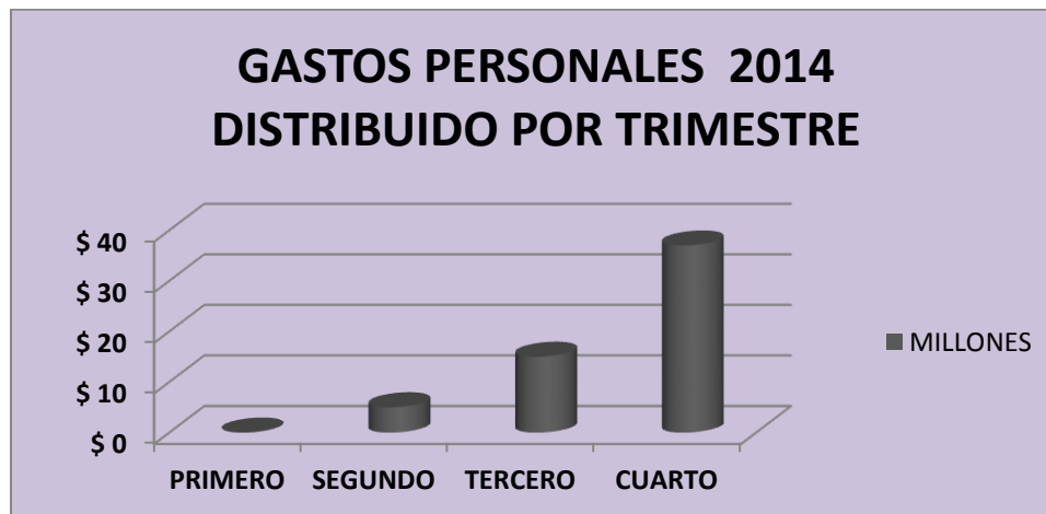
Grafico N° 7