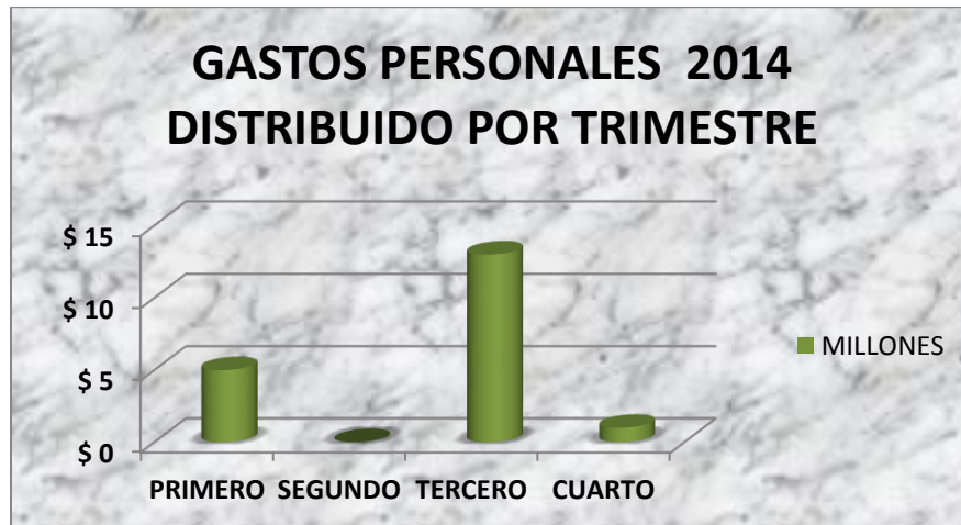
Grafico N° 3

La variación de pago entre el tercer trimestre con los otros trimestres obedece, principalmente, a que el trámite de liquidación contractual, en ocasiones, retrasa los pagos haciendo que se acumulen de un trimestre a otro. Cabe mencionar que en el último trimestre, de la vigencia en estudio, se cumplió el objeto contractual de