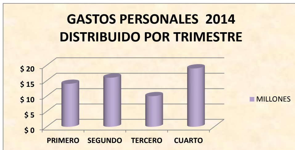
Grafico N° 5