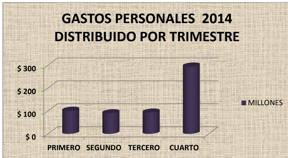
Grafico N° 2

Para el año 2014, la Administración Municipal de Cartago, registró por gastos de servicios personales indirecto correspondiente al Concejo y Alcaldía un monto de $578 millones; para el cuarto trimestre se reportaron gastos por valor de $294 millones, un promedio de consumo por mes de $48 millones de pesos.