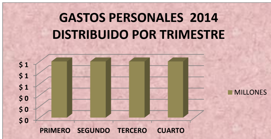
Grafico N° 4